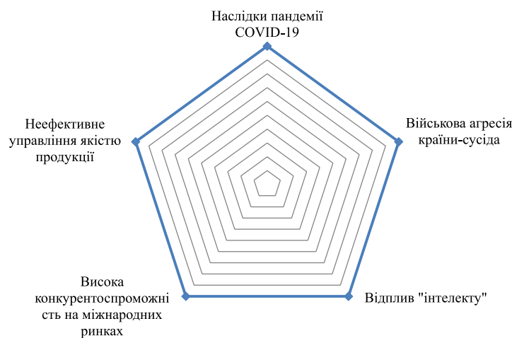
Рис. 2. Основні загрози системи державного регулювання регулювання стандартизації й сертифікації продукції в Україні

В умовах війни, особливо гостро стає питання стандартизації і сертифікації продукції, оскільки України є частиною міжнародної продовольчої безпеки і прагне уможливити підвищення її рівня, навіть коли країна-агресора постійно цьому протистоїть.